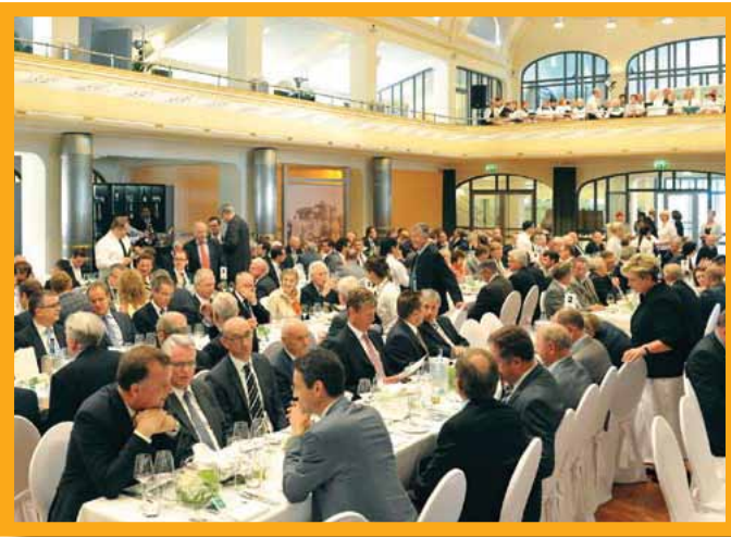
Oko 200 kupaca i specijalnih gostiju pridružilo se slavlju u Portland Forumu u Leimenu

10. jula 2013 godine, pod sloganom "Od Berghemskog mlina do multinacionalnog preduzeća", održana svečana proslava 140 godina od osnivanja kompanije kojoj je prisustvovalo oko 200 kupaca i specijalnih gostiju