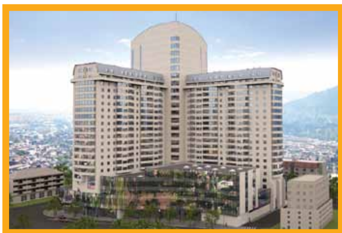
Hotel Uni Bristol Tuzla