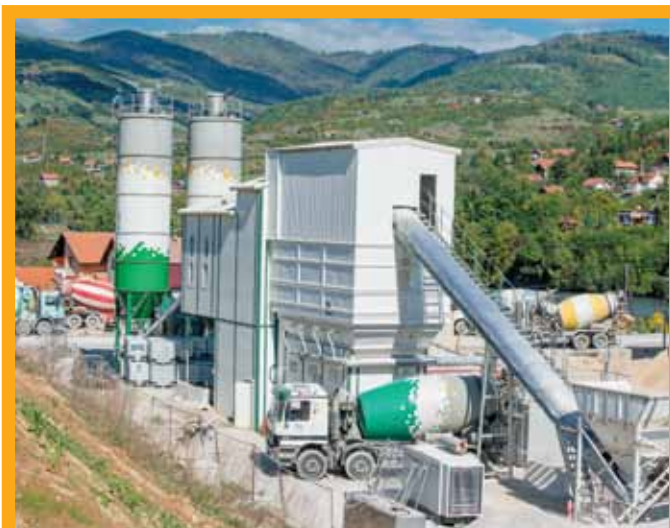
Mobilna betonara u Drivuši

pumpne kapacitete, što nam se višestruko vraća," kaže Šehmehmedović.