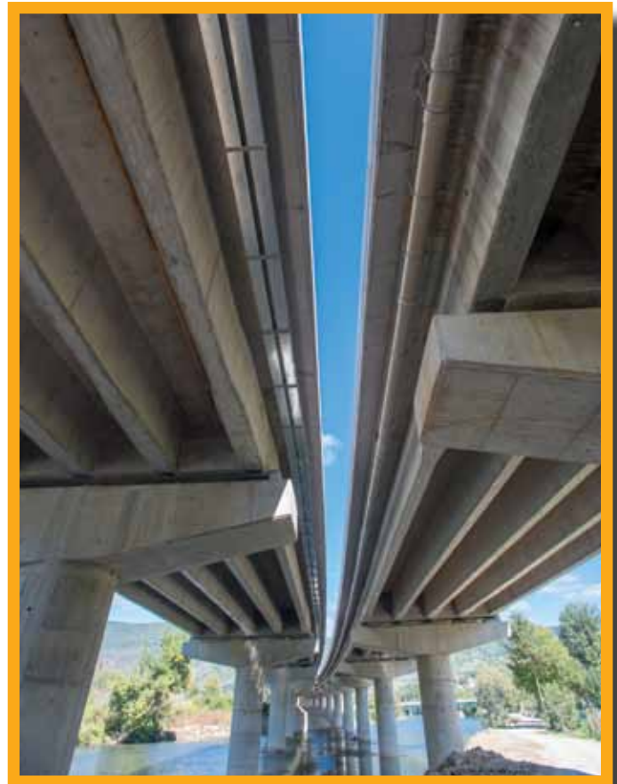
Most na autoputu - Drivuša

Od 2010. godine, od kada je operativna, pa do kraja oktobra 2013, mobilna betonara proizvela je više od 161 hiljade kubnih metara betona. Kompletna proizvodnja betonare isporučena je primarno u tunele Vijenac i vijadukte i mostove na LOT-u 3 autoputa na koridoru 5c. "Kvalitet našeg betona je bio presudan za ovakav intenzivan angažman, a da bi zadovoljili potrebe investitora obnovili smo i ojačali naše transportne i