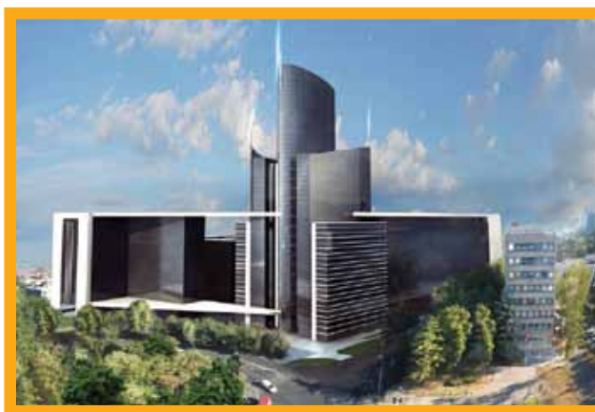
Stambeno-poslovni kompleks Grand Trade Banja Luka